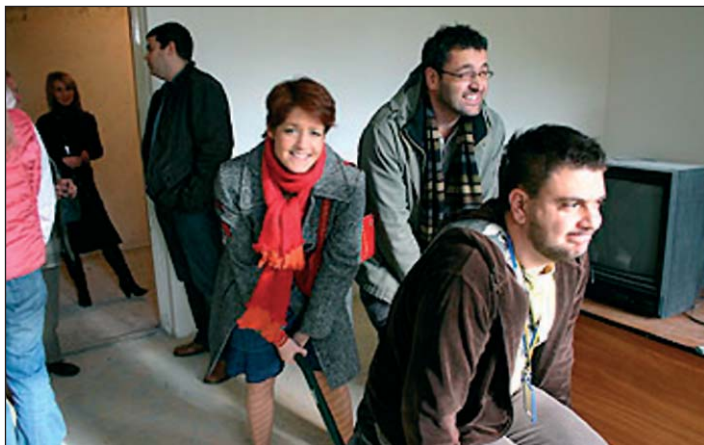
A Danubius Csili csapata

- Olvasóink hallották, mi rákérdeztünk -