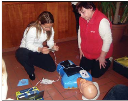
A defibrillátoros csapat