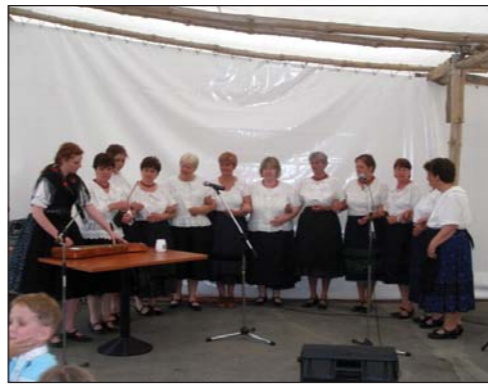
Az összefogás napja