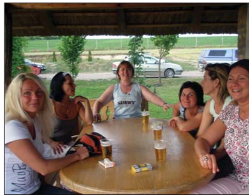
Az összefogás napja