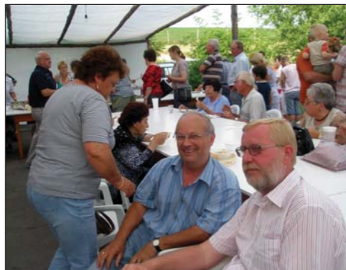
Az összefogás napja