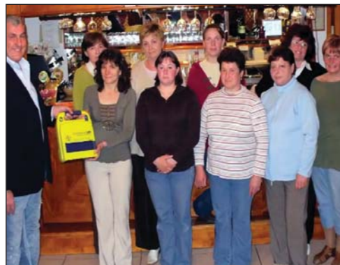
A defibrillátoros csapat