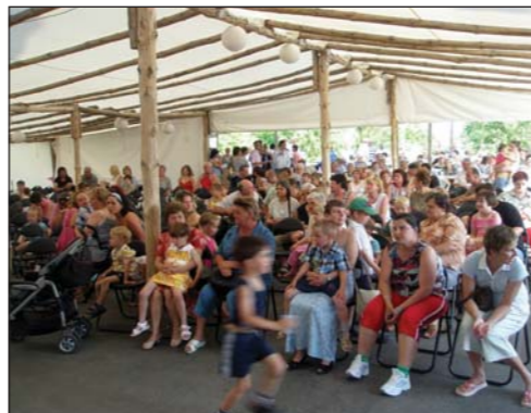
Az összefogás napja