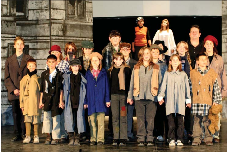
A gyúrói tábor, KOMISZ társulata

A "Jövőt Nekik is" Alapítvány és a Baptista Szeretetszolgálat Komédiás Integrált Színháza szervezésében szeretettel várunk minden kedves fiatalot (korhatár nélkül) az augusztusban megrendezésre kerülő színjátszó táborba.