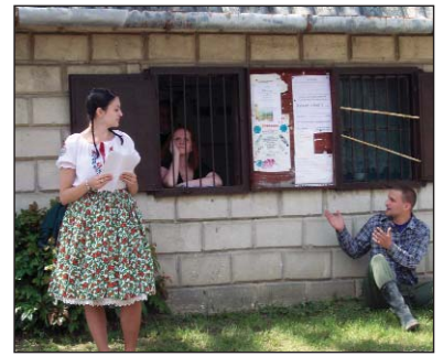
A T.I.K. a Tordasi Rómeó és Júlia vásári "tragédiával" szórakoztatta a nagyerdemüt