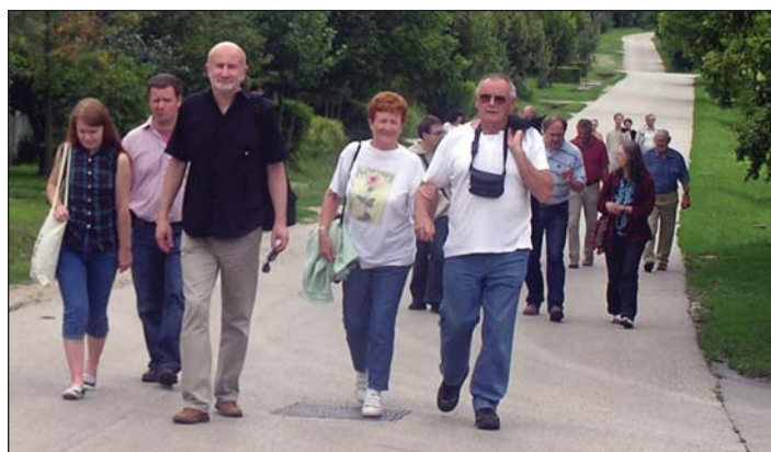
Túra a Hangya soron