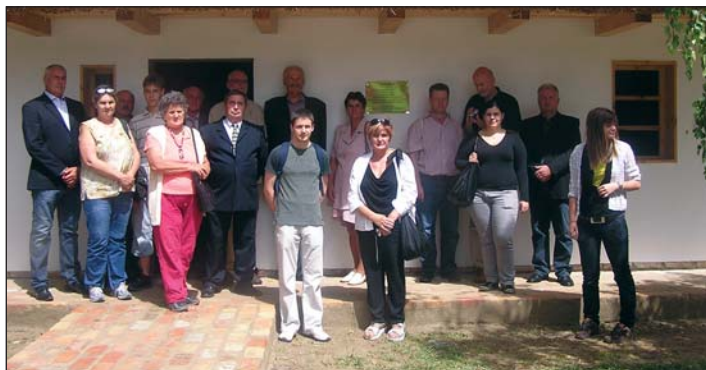
Emléktábla avatás után a HANGYA Tájháznál