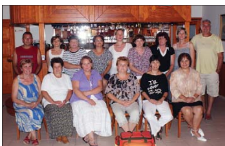
A Tordasi Defibrillátoros Csapat

A tordasiakért önként vállalt munkájukat továbbra is nagy megbecsüléssel honoráljuk!