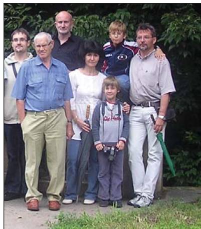
Csapatunk a Cifra hídnál