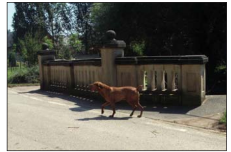
Cifra híd A kutyát sem érdekli???

Ez a program és a környezeti állapot indította az értékmegőrzőket arra, hogy méltó körülményt próbáljon teremteni, hogy az emléktúra résztvevői gondozott állapotokat találjanak. Néhányan neki álltunk és elvégeztük azt, ami egyébként az önkormányzat kötelessége lenne. Aztán befejeztük. Álltunk a hídon, néztük a "Ló" folyó sáros vizét, amint sebesen eltűnik a híd alatt. Az éjszaka eső esett a patak völgyében. A víz felett színes szitakötők táncoltak. Békés nyugalom vett körül bennünket. Visszatért a rend!